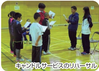
キャンドルサービスのリハーサル

管内事業としては道スポ少交流大会の剣道とバレーボールの予選会をはじめ、認定員養成講習会とジュニアリーダー交流研修会を行い、Jrリーダースクールの認定を受けて毎年開催して多くの団員