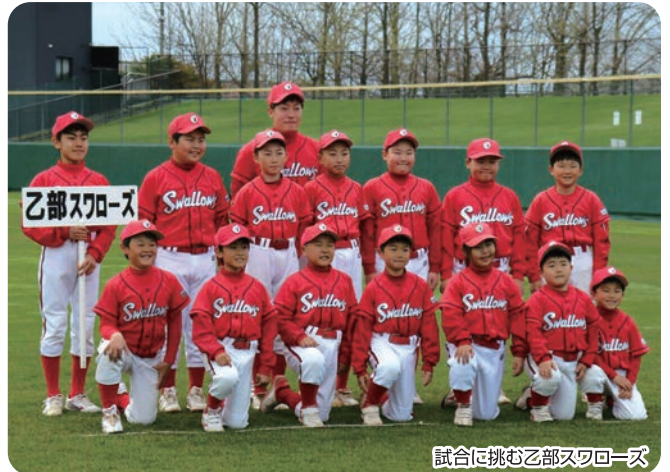
試合に挑む乙部スワローズ

会優勝などがあり、今年度は、日頃の練習の成果を發揮し、5月の道南地区予選のマクドナルド大会では2回戦まで進出、9月のうみ街信金大会でも2回戦まで進出、どちらの大会も惜しくも敗れてしまいましたが、全道大会進出常連チームと戦う事が出来ました。また、檜山地区大会でも常に2回戦に進出しチーム力がつき成績が向上しています。