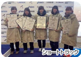
ショートトラック