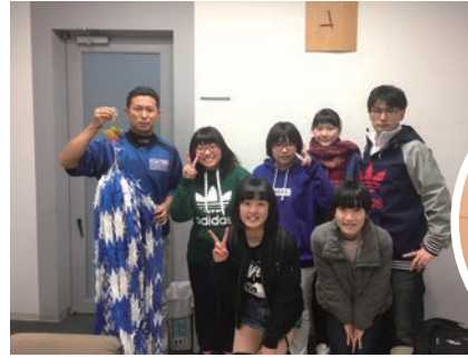
日ハム1軍マネージャへ「千羽鶴」贈呈