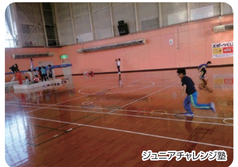
ジュニアチャレンジ塾

大人の部としては毎年7月に北海道スポレッククラブ選手権大会を開催しており、30年度で3回目を実施しています。開催地的に遠方なため参加チームは少ないのですが、これからも開催していく予定です。少しでも町民の方々に貢献できるように活動していきます。