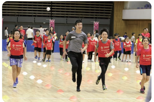
【スポーツチャレンジ教室】桐生選手を目の前にして、目をキラキラさせてかけっこ教室に参加していました