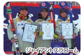
ジャイアントスラローム