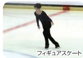
フィギュアスケート