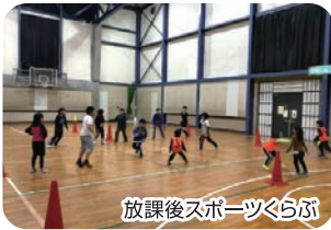
放課後スポーツくらぶ