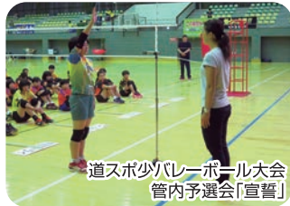
道スポ少バレーボール大会 管内予選会「宣誓」