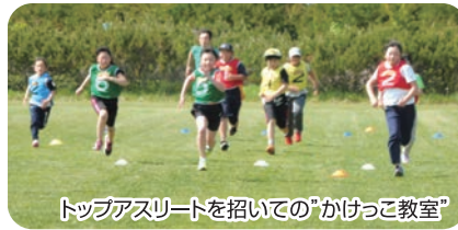
トップアスリートを招いての「かけっこ教室」