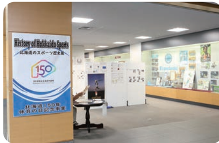
【北海道150年記念事業】北海道のスポーツ歴史展を開催しました