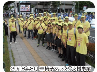
2018年8月 車椅子マラソン支援事業

近年は各種全国大会において数多くの成績上位者を輩出するだけでなく、幅広い年代が生涯スポーツとしてまた、中学武道必修化授業に向けての修練カリキュラムの研究・展開もしています。