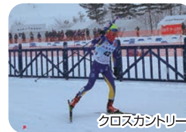
クロスカントリー