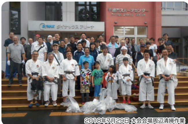
2018年7月29日 大会会場周辺清掃作業

少林寺拳法は「自己確立」と「自他共栄」を基本理念として、拳の修行を通し武道としての側面と精神修養と人格形成を行う社会教育活動の側面を持ち、現在は北海道内において115カ所の道院拳友会、地域・実業団支部、大学支部、高校・中学の部が活動を行っています。