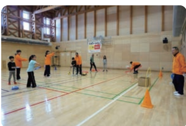
ヘキサスロン体験(こどもクラブ体験教室)

当クラブの活動拠点、旭川市末広地域活動センター(あつま〜)が平成27年4月30日完成オープンしました。行政より総合型地域スポーツクラブの立上げを助言され平成25年・26年の設立準備期間の後、平成27年2月8日に設立総会を経て総合型地域スポーツクラブとして発足しました。