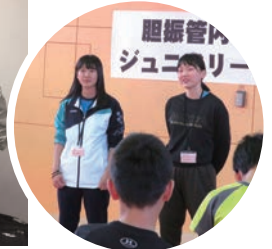
伊達シニアクラブの リーダー達