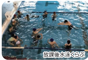
放課後水泳くらぶ