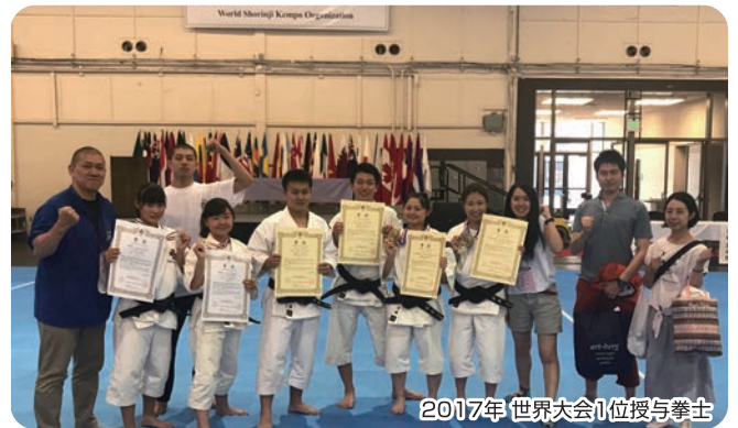
2017年 世界大会1位授与拳士

近年は各種全国大会において数多くの成績上位者を輩出するだけでなく、幅広い年代が生涯スポーツとしてまた、中学武道必修化授業に向けての修練カリキュラムの研究・展開もしています。