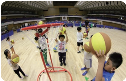
【レバンガ北海道バスケットボールアカデミー体験会】子どもたちの笑顔が絶えない体験会となりました