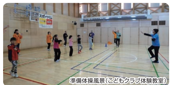
準備体操風景(こどもクラブ体験教室)

現在は自立支援事業3年目の申請に入り、自立支援事業種目を含め、スポーツ・文化と多種目にわたり22のサークルと354名の会員が活動しています。