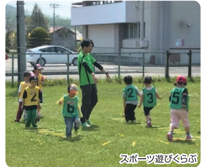
スポーツ遊びくらぶ

スポーツに触れる機会の少ない子供たちに、スポット的に「スポーツ教室」を開催していましたが、平成28年4月「釧路市阿寒町総合運動公園」の指定管理を受託したことから、幼稚園・保育園児を対象とした「スポーツ遊びくらぶ」、小学生を対象とした「放課後スポーツくらぶ」「放課後水泳くらぶ」を開催。また、「トップアスリートを招いてのかけっこ教室」や、平成29年度からは高齢者の介護予防活動にも取り組んでいます。