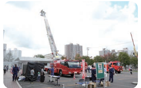
【豊平消防署「秋の火災予防運動～ファイヤーランド119～」】多くの子供たちがはしご車の試乗を楽しんでいました