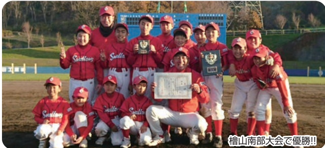
檜山南部大会で優勝!!