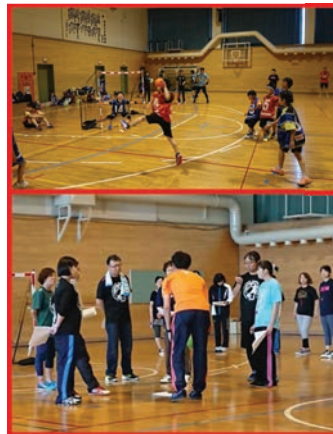
SH審判・指導者講習会も開催

潮クラブは函館市において2015年、総合型地域スポーツクラブとしての取り組みを始めました。現在はドッジボール、ギッズダンス、ASOBIBAKIDSとストリートハンドボールの活動をしています。対象は子供と保護者が中心。ストリートハンドボール(以下SH)は2006年デンマークで誕生し、2017年に総合型潮スポーツクラブが日本の窓口となって普及をしているニュースポーツです。SHは北欧のスポーツカリキュラムが導入され、勝ち負け先行ではなく楽しむためのルールとなっています。勝利至上主義には結びつかない指導内容と活動の基本理念です。また、ASOBIBAKIDSはボール遊びや音楽に合わせてカラダを動かす活動です。これを通し、地域に1つでも貢献していけるように頑張ります。