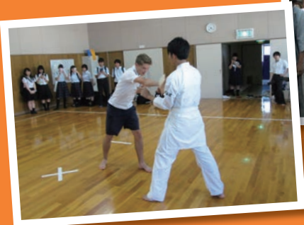
留萌高校にて空手体験板割り