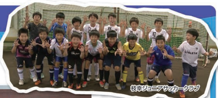
枝幸ジュニアサッカークラブ

枝幸町スポーツ少年団は、平成18年の旧枝幸町と旧歌登町の合併に伴い、新たに組織を立ち上げました。現在は13種目、18団体が枝幸地区、歌登地区で活動し地区合同の練習会もしているようです。体育館では思うような練習時間が取れなかったのが学校の体育館が解放され練習日を増やし団員のレベルアップもされています。今年度はサッカー場が新設されより練習を楽しんでいる様子うかがえます。スキー場も整備が行き届きレーシングの子ども達も寒さに負けず滑走しています。また年に一度、表彰式時に軽スポーツやレクゲーム等で子ども達の交流を深めています。今年度は宗谷管内スポーツ少年大会開催、そして初の日独スポーツ少年団同時交流の受け入れをしました。管スポにドイツの子も参加してもらい日独交流の一環に。子ども達はすぐに打ち解け楽しんでいる様子で、安堵しました。今後も子ども達の活動を見守っていききたいと思います。