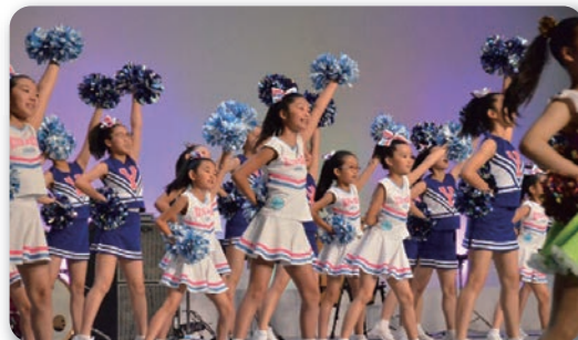
きた☆キッズによるチアダンス