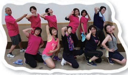
エアロビクス教室、仕上げは決めポーズ!

平成15年4月、総合型地域スポーツクラブとして風連スポーツクラブ「ポポ」は誕生しました。以来15年間地域に根ざしたスポーツクラブとして「楽しみながらの健康づくり・競技力向上」をめざし活動を続けてきました。その中で次のステップに向け昨年度は法人格取得を行い、現在は「一般社団法人風連スポーツクラブ」として16年目の活動を行っています。特徴的な活動の一つに「ふうれん健康美人塾」があります。性別や年齢に関係なく、健康な身体は美しさの根源であり日々の生活そのものの豊かに繋がります。エアロビクス、ピラティス、インテスタージュを初め陶芸、坐禅等8事業を通して心身両面での健康美人をめざし楽しく活動しています。他にも教室・イベント・定期活動など盛りだくさんの一年は、仲間の笑顔と共にあっという間に過ぎていきます。