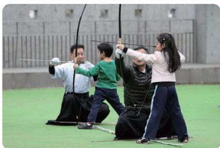
弓道体験会 札幌弓道連盟の先生による指導