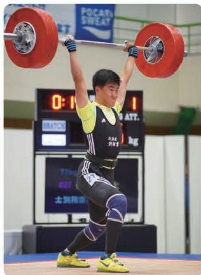
H30インターハイにて

中学生、高校生、大学生、社会人、マスターズに至るまで、幅広い年齢層で全国的に活躍し、中には日本公認記録を保持している選手もいます。