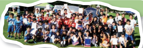
ストリートハンドボール交流大会 in 函館 楽しく遊んだみんなと記念写真!!