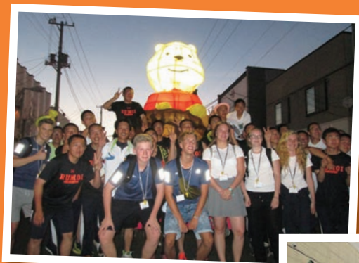
地元高校生と撮影