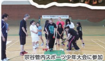
宗谷管内スポーツ少年大会に参加