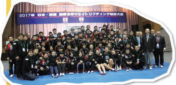
2017日韓国際友好大会

にも、次の世代を担う指導者の育成は、私たちにとって急務です。今後ともよろしく願いいたします。