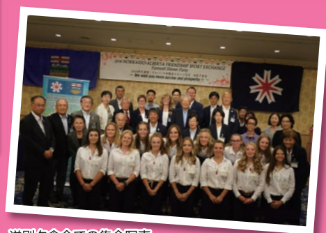
送別夕食会での集合写真