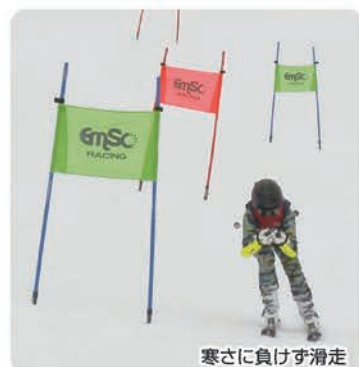
寒さに負けず滑走