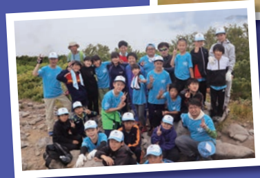
登山集合写真 2グループ