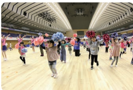
きた☆キッズチアダンススクール体験会 皆でポンポンを持ってダンスをしました