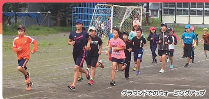
グラウンドでのウォーミングアップ

西当別RCスポーツ少年団は、当別町にある西当別小学校に通う小学1年生から6年生の34名で活動しています。陸上競技を通して心と体を鍛え、目標に向かって頑張る心を育てています。走る楽しさを体で感じ、個人で努力するだけでなくチーム全員で競い合い、励まし合いながら活動しています。