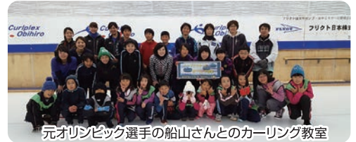
元オリンピック選手の船山さんとのカーリング教室

がそれぞれ持っている強みを活かす形で、事業に合わせて2~3のクラブが協力合っています。全クラブが一堂に会う機会はもちろん必要ですが、より日常的に連携し合い、補完し合えるネットワークでありたいと進めています。