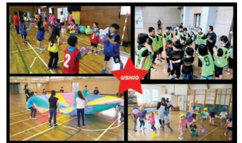
日々の活動 ハンドボール・キッズダンス・ドッジボール・ASOBIBAKIDS