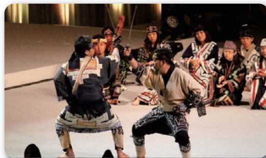
アイヌ文化伝承芸能