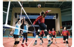
第22回日韓スポーツ交流・成人交歓交流 派遣交流の様子