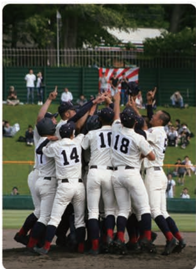
南北海道大会優勝

加盟校の主な戦績は駒大苫小牧高校の平成16年、17年の全国選手権大会連覇、翌18年の準優勝、東海大四高校(現東海大札幌高校)の