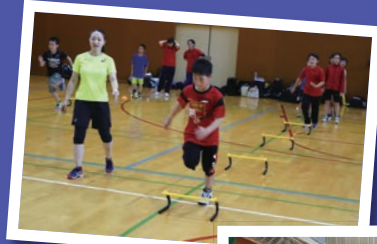
アイスブレイキング (北風氏)

参加した団員たちは、国や地域や競技の異なる団員との集団生活を通して得た貴重な経験をそれぞれのスポーツ少年団で活かし、将来のリーダーとして活躍するでしょう。