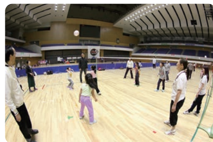
北海道発祥のスポーツ ミニバレー体験会 柔らかいボールで楽しくミニバレーが出来ました