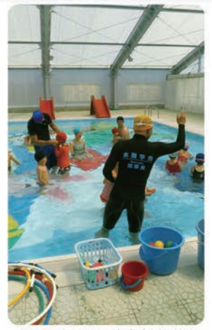
親子で楽しむちびポポ水泳教室