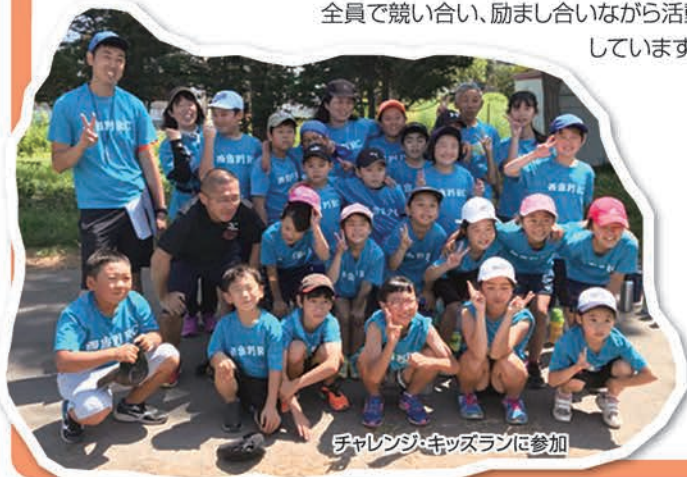
チャレンジキッズランに参加

春から夏は、小学校のグラウンドや岩見沢の陸上競技場などでリレーや走り幅跳び、ジャベリックスロー、100M・800Mなどの専門的な練習をしています。秋は駅伝に参加し、冬は小学校の体育館で鬼ごっこやボール運動などさまざまな動きをトレーニングに取り入れて練習しています。大会には、北海道小学生陸上競技大会に向けて予選会や記録会に参加したり、小樽や苫小牧などの地方大会にも参加したりしています。